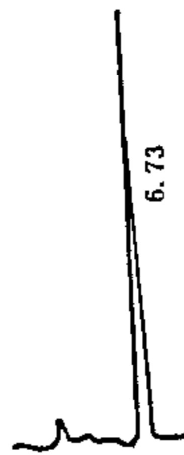
图 1 牛磺酸衍生物 HPLC 色谱图